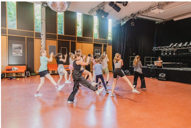
Viel Spaß und Bewegung im Tanz-Camp. © Gökçe Messmer