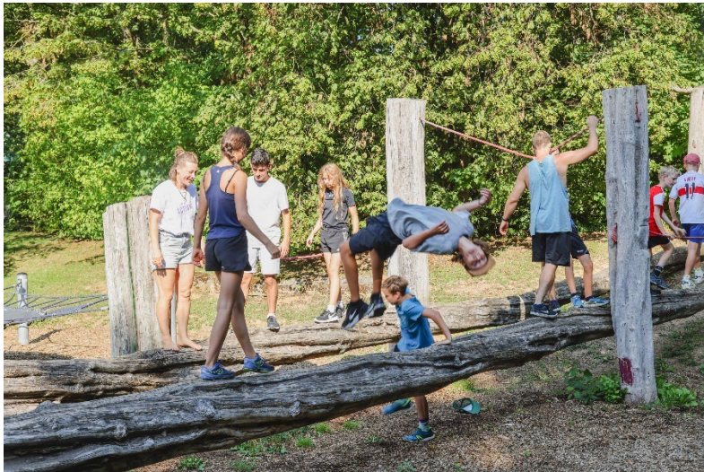
Action und coole Moves im Parkour-Camp.

Mehr Informationen: https://www.ich-will-action.net/ /// Rückfragen: Silvana Dürschmied Tel.: 0711-51898675, E-Mail: info@ich-will-action.net